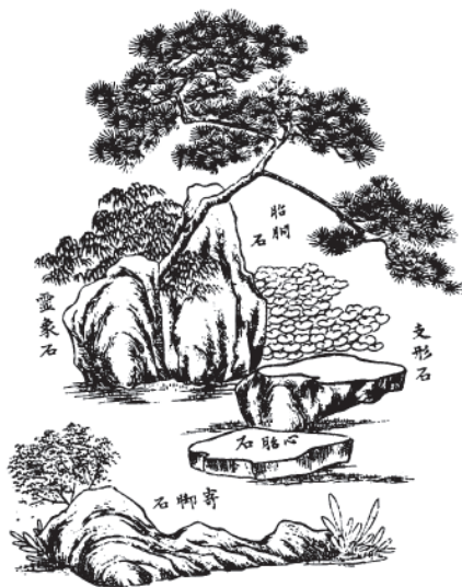
Сад каменів в Японії

формації, що дозволяє використовувати його для різноманітних видів навчальної діяльності.