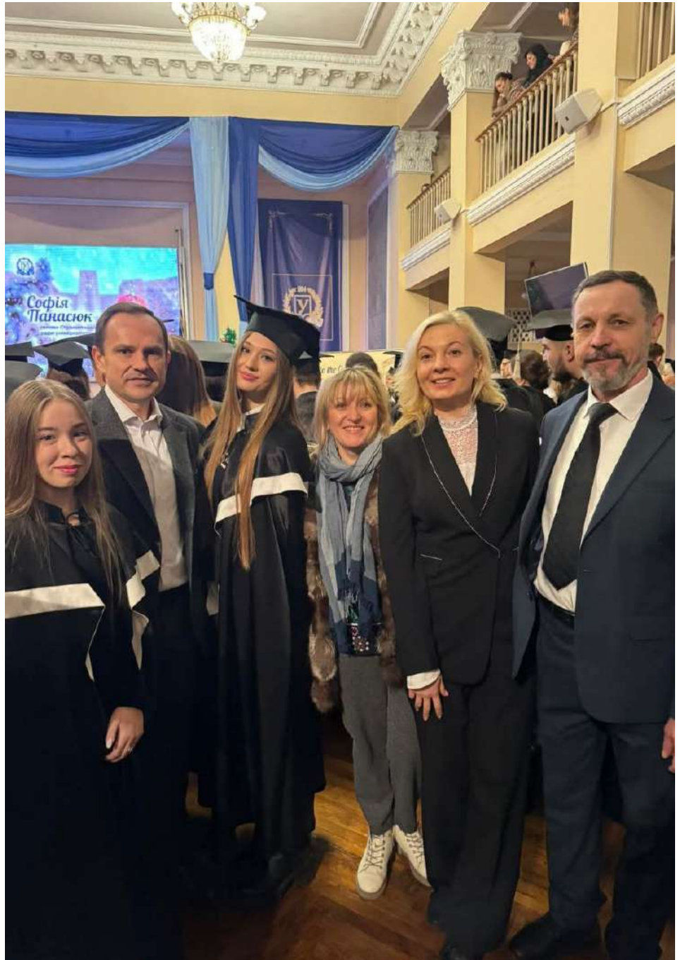
Урочистий випуск магістрів-2024 у Каразінському університеті.

Наразі в Харкові працює приблизно 10 туристичних компаній, які надають послуги. Це не лише туристичні, а і послуги пов'язані з бронюванням квитків і готелів, оформленням страхування тощо. Виліт відбувається через Польщу, Молдову і, відповідно, спілкуючись з представниками