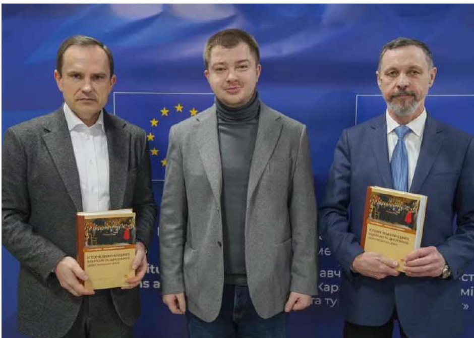
Урочистий фінал тижня дипломатії. Презентація навчального посібника з Історії міжнародних відносин та дипломатії, виданого до 220 річчя Каразінського університету.

– Каразінський має розвинуту інфраструктуру дистанційної освіти, екосистему дистанційної освіти: від електронного розкладу деканату і до платформи Moodle. Що стосується туризму в Каразінському, то наша