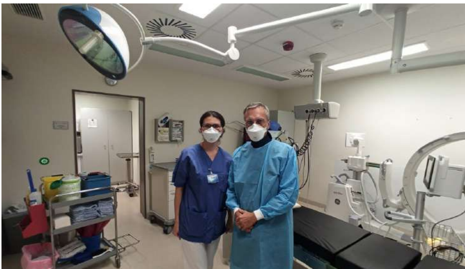
Проф. Крістоф Ланге. Дослідницький Центр Борстель, Німеччина

– По-перше, миру та перемоги! По-друге, вивчайте англійську, адже це подарує вам можливість вільного спілкування з колегами, ознайомлення з працями інших дослідників, виступів на міжнародних конгресах та долучення до наукових досліджень.