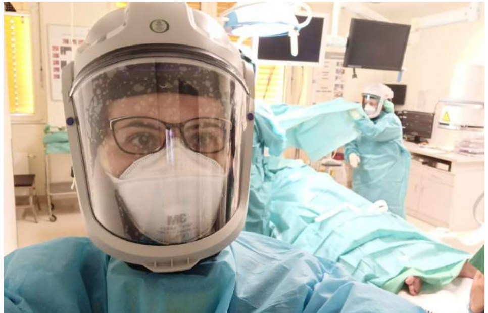
Операція на легенях у пацієнта з туберкульозом, клініка в Німеччині

– На жаль, більшість студентів перебуває не в Харкові, що заважає їм брати участь у дослідженнях. Адже більшість проєктів повинні проводити локально, необхідно приходити до лікарні, спілкувати-