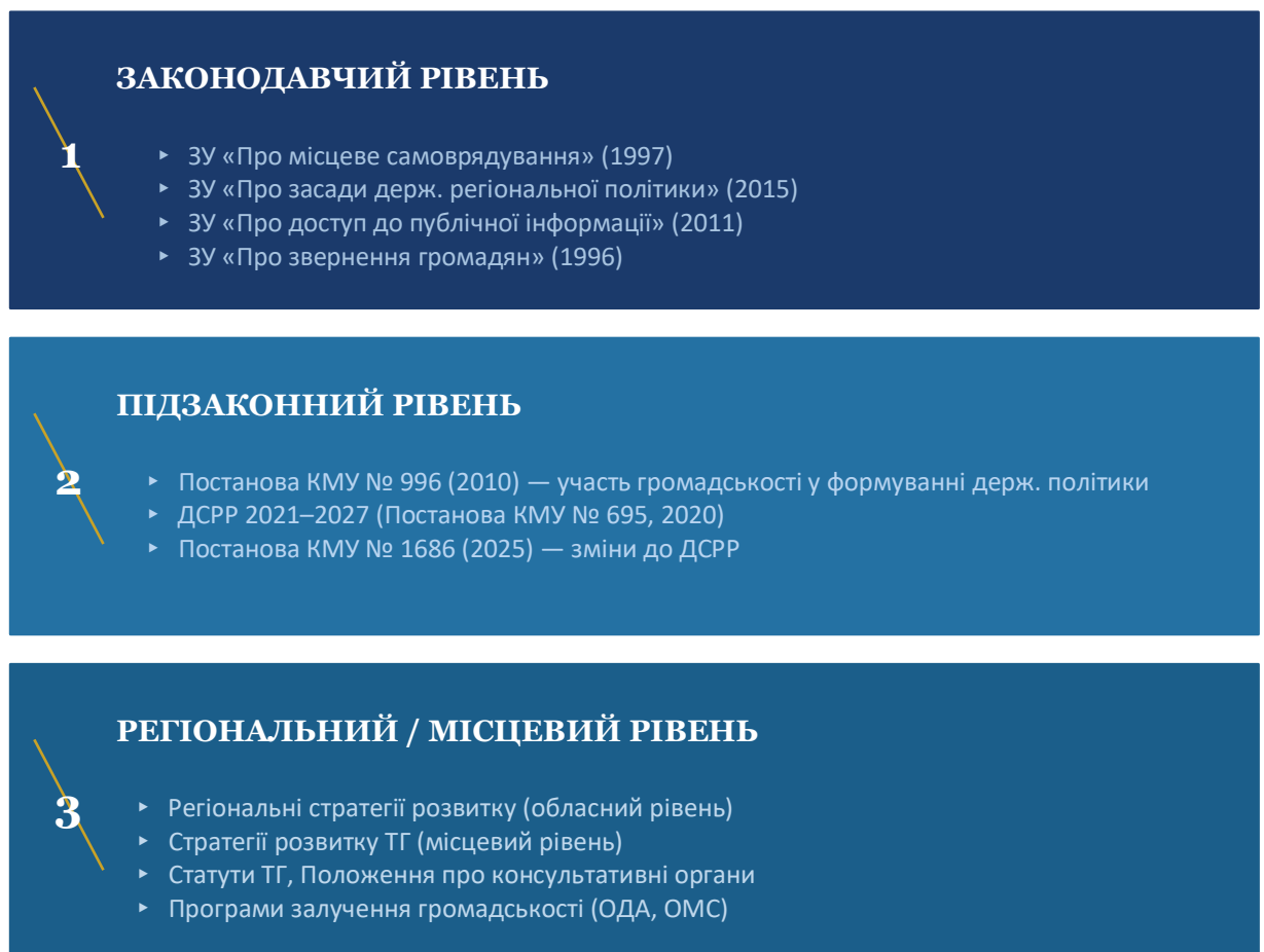
Рис. 2.1. Нормативно-інституційна система публічно-громадської взаємодії в Україні

Аналіз чинної нормативної бази взаємодії громадськості та органів публічної влади у сфері регіонального розвитку виявляє низку системних характеристик, що суттєво впливають на її практичну дієвість і потребують предметного дослідницького осмислення (рис. 2.1).