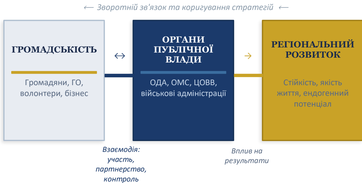
Рис. 1.1. Концептуальна схема публічно-громадської взаємодії у забезпеченні регіонального розвитку

Наведене трактування є ширшим за суто процедурне розуміння участі, оскільки включає як формальні механізми, закріплені у нормативних актах, так і неформальні практики взаємодії, що нерідко мають не менший вплив на перебіг регіональних процесів. Воно також є вужчим за розмиті поняття «відносини влади та суспільства» чи «громадянська участь» у найширшому їх трактуванні, оскільки акцентує на цілеспрямованому, орієнтованому на результат характері взаємодії [233, 201].