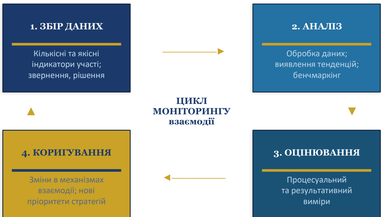
Рис. 3.2. Система моніторингу та оцінювання впливу публічно-громадської взаємодії на результати регіонального розвитку

четверте, результати моніторингу повинні використовуватись насамперед для навчання і вдосконалення, а не для покарань – такий підхід забезпечує більшу відкритість до звітності і, відповідно, точнішу картину реального стану взаємодії. По-п'яте, система моніторингу повинна бути динамічною і адаптуватись до нових реалій, зберігаючи при цьому методологічну послідовність і порівнянність даних у часі – що є принциповим балансом між гнучкістю і надійністю – включаючи умови воєнного стану і повоєнного відновлення, – що є умовою збереження її актуальності і практичної корисності протягом тривалого часу.