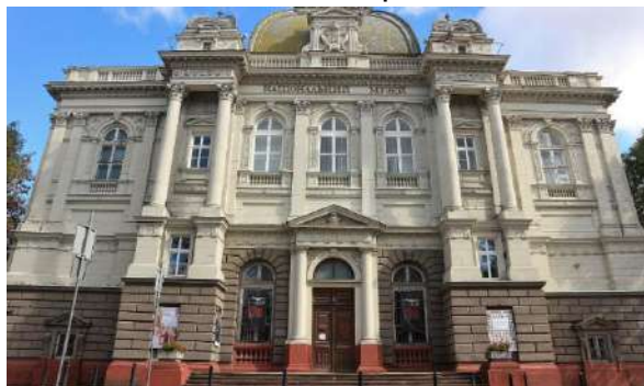
Національний музей у Львові

Андрей Шептицький – успішний банкір. Він заснував Сільськогосподарський іпотечний банк, ставши головним інвестором і вклавши в нього 1 мільйон крон. Митрополит також був ініціатором і засновником Земельного банку у Львові, що створений у 1910 році. Це один із перших українських банків, який здобув визнання за межами Австро-Угорської імперії та чиї фінансові потоки перебували в Україні, а не у Відні, як було прийнято в ті часи. Андрей Шептицький допомагав селянам отримувати важливі кредити на землю за спеціальними умовами та з відтермінуванням виплат по них.