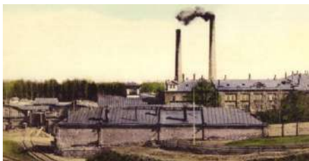
Сумський рафінадний завод

У 1869 році в Сумах Іван Харитоненко побудував найбільший цукровий завод, названий пізніше Павловським. Цього ж року Іван Харитоненко увійшов у п'ятірку найвідоміших підприємців російської імперії.