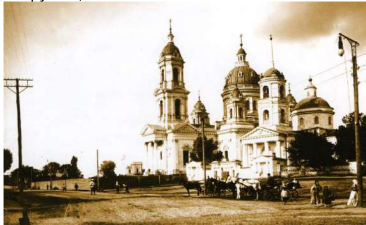
Троїцький собор на початку ХХ століття

Ставши «цукровим королем», Павло Харитоненко, наслідуючи приклад батька, долучився до меценатства. Завдячуючи фінансовій допомозі Павла, місто Суми стало одним із найкращих на Слобожанщині в архітектурному та культурному плані. Були побудовані Троїцький собор, Костел Благовіщення Пресвятої Діви Марії, Олександрівська чоловіча гімназія з пансіоном, проведена реконструкція Спасо-Преображенського собору тощо.