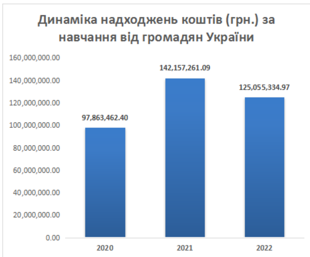
Рис. 12.2. Динаміка надходження коштів за навчання (грн)

Відомості про кількість студентів-контрактників та надходження коштів за навчання на спеціальний рахунок університету наведені нижче.