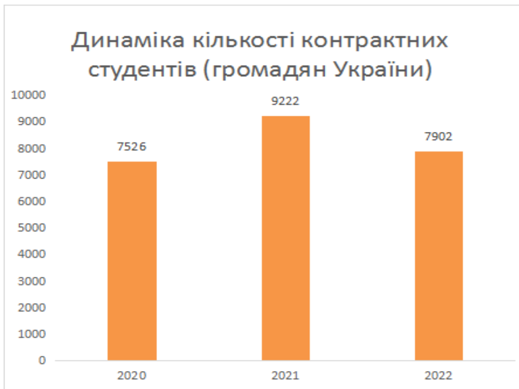
Рис. 12.3. Динаміка кількості контрактних студентів (громадян України)