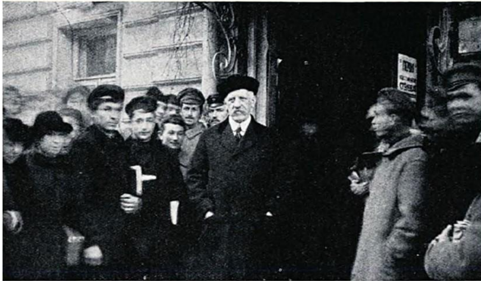
Фрітьоф Нансен з харківськими студентами біля входу до їдальні (28 січня 1923 рік)