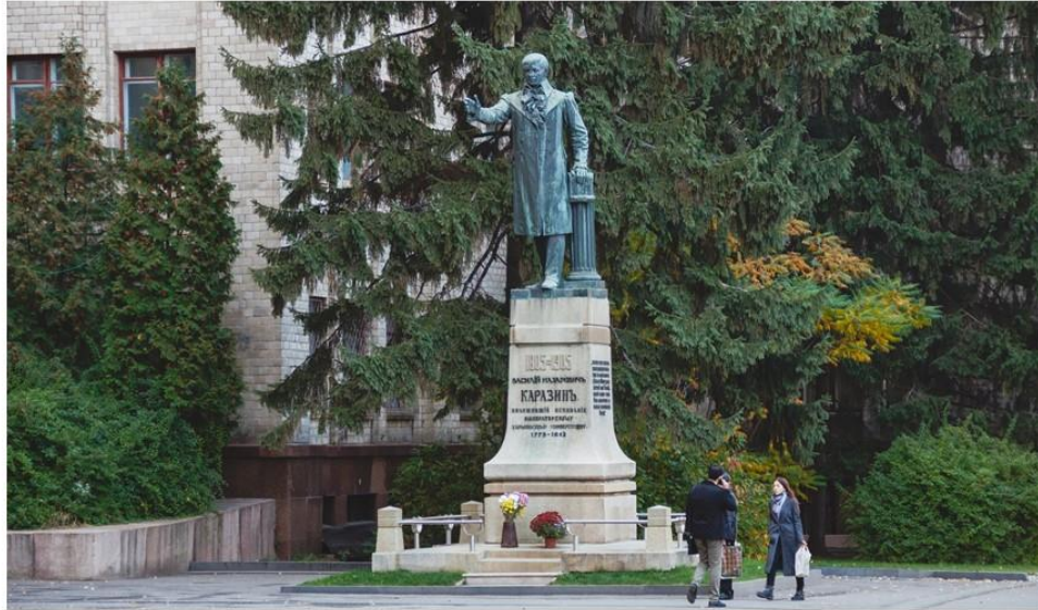
Засновник університету – Василь Назарович Каразін