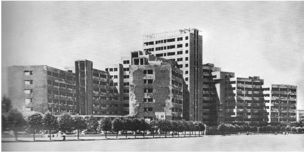
Зруйнований під час війни Будинок проєктів – майбутній головний корпус Харківського університету

ХАРКІВСЬКИЙ УНІВЕРСИТЕТ: ТРАДИЦІЇ БЛАГОДІЙНОСТІ