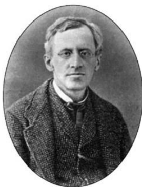
Бецький Іван Єгорович (1818–1890)