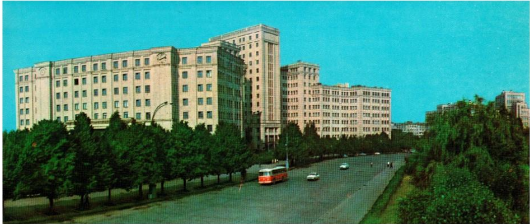
Харківський університет у 1971 році (через 8 років після того, як його було повністю здано в експлуатацію)