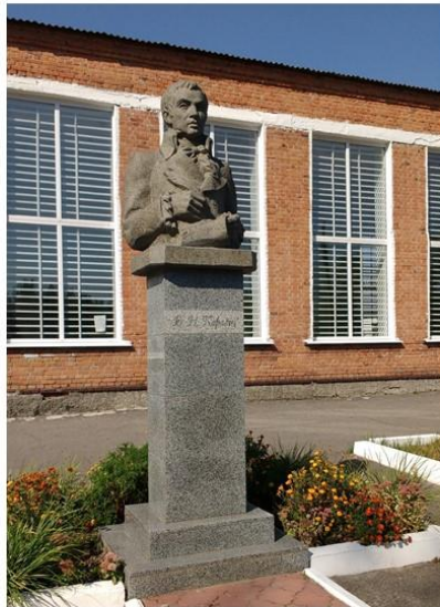
Пам'ятник В. Н. Каразіну в селі Кручик

ХАРКІВСЬКИЙ УНІВЕРСИТЕТ: ТРАДИЦІЇ БЛАГОДІЙНОСТІ