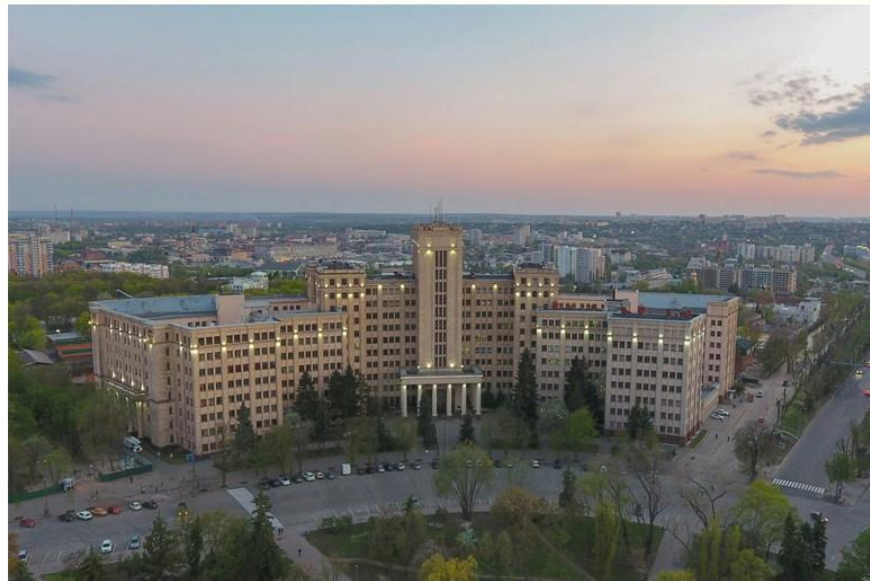
Головний корпус Каразінського університету (2018 рік)