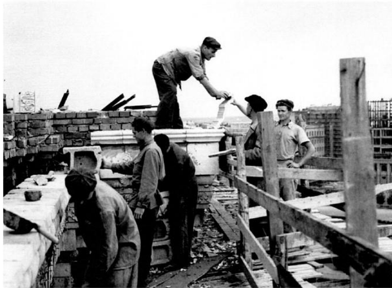
Студенти відбудовують майбутній головний корпус університету

ХАРКІВСЬКИЙ УНІВЕРСИТЕТ: ТРАДИЦІЇ БЛАГОДІЙНОСТІ