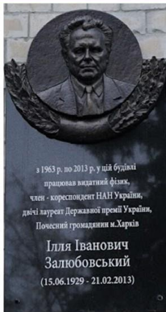
Меморіальна дошка на честь фізика, професора та проректора Харківського університету І. І. Залюбовського

Знаходиться на фасаді головного корпусу Каразінського університету (майдан Свободи, 4)