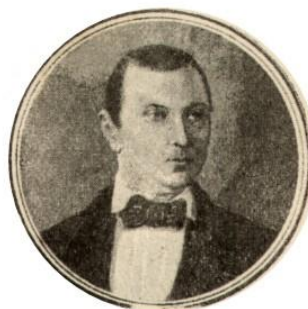
Алфьоров Аркадій Миколайович (1811–1872)