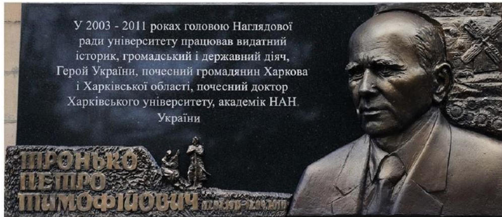
Барельєф на честь видатного історика, громадського і державного діяча, Героя України, почесного доктора Харківського університету П. Т. Тронька. Знаходиться на фасаді головного корпусу Каразінського університету (майдан Свободи, 4)