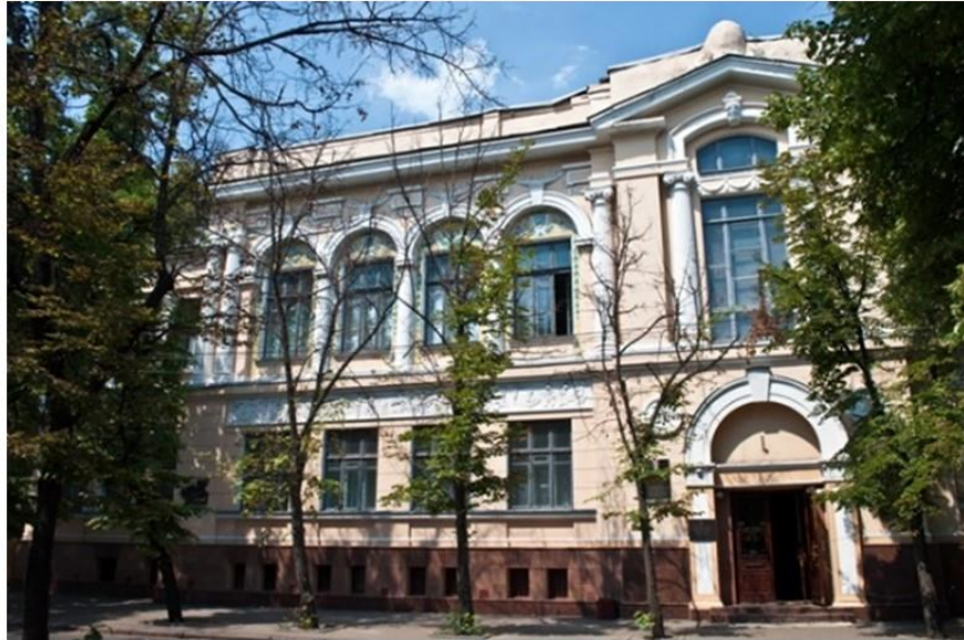
Нині гравюра А. Дюрера зберігається у Харківському художньому музеї