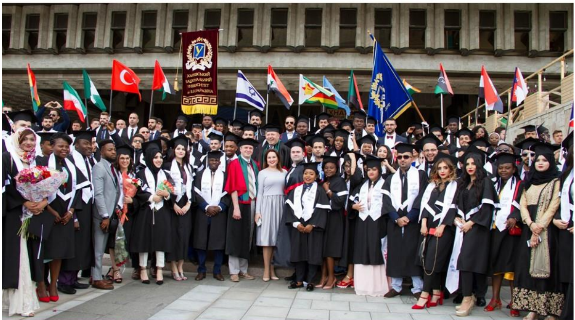
В. С. Бакіров ректор Харківського національного університету імені В. Н. Каразіна